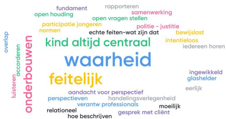
Tabel 4. Woordenwolk beleidsmedewerkers

De beleidsmedewerkers hechten waarde aan een te objectiveren feitenonderzoek waarbij het kind centraal staat. Het goed onderbouwen van het feitenonderzoek waarbij cliënten een actieve rol spelen vinden zij belangrijk. Woorden als onderbouwen en samenwerken illustreren dit.