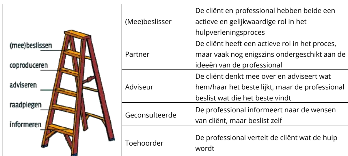
Tabel 5. De participatieladder

In dit hoofdstuk bespreken we eerst wat er volgens cliënten niet goed gaat in de participatie (3.1). Aansluitend worden de verbeteruggesties uit de focusgroepen weergegeven (3.2 t/m 3.4).